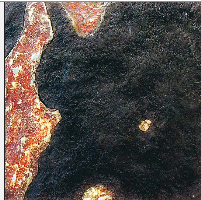
Værkerne ligner naturskabte fænomener.