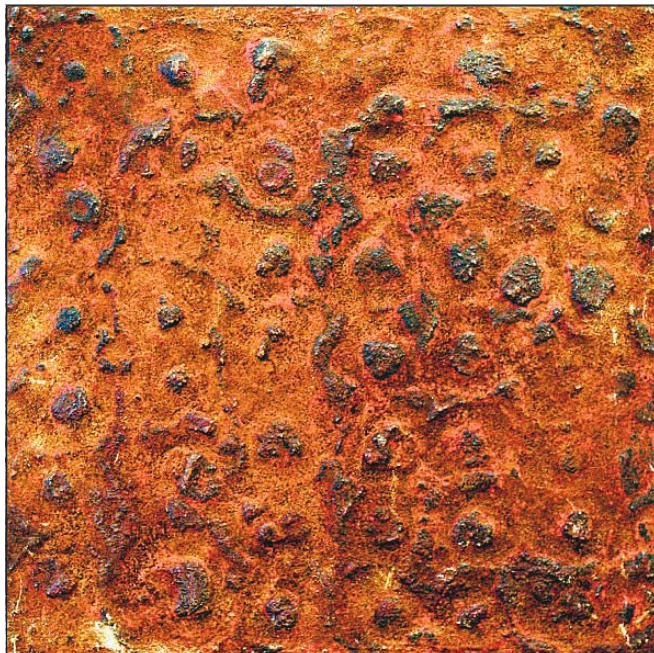
Glødende farver og geologiske strukturer.